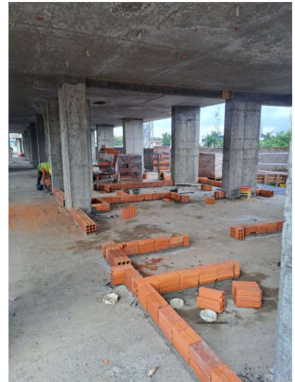
Avance de albañilería