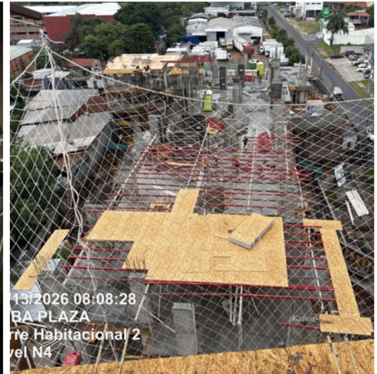
Cargamento losa N4